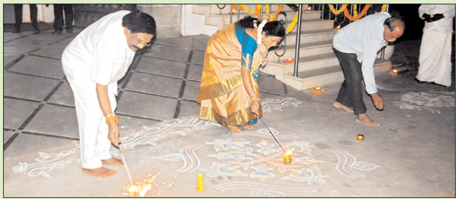
దీపావళి సందర్భంగా ఒంగోలులోని తమ నివాసంలో బాణాసంచా కాల్చి సంబరాలు చేస్తున్న మాజీ మంత్రి శిర్డీ రాఘవరావు, లక్ష్మీపద్మావతి దంపతులు.