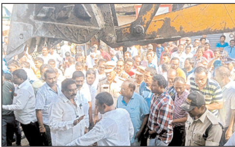
గొడవ సద్దు మణిగింది. అనంతరం యధావిధిగా ఆక్రమణ కట్టడాలను మున్సిపల్ అధికారులు తొలగించారు.

కనిగిరి, మేజర్ న్యూస్: పట్టణంలోని ప్రధాన రహదారుల ఆక్రమణల తొలగింపులో ఉద్దిక్తత పరిస్థితులు నెలకొన్నాయి. స్థానికులు ప్రధాన రహదారుల వెంబడి మున్సిపల్ స్ట్రీట్లను ఆక్రమించి కట్టడాలు నిర్మించారు. రహదారులు విస్తరణలో భాగంగా మున్సిపాలిటీ కమిషనర్ డానియెల్ జోసఫ్ ఆదేశాల మేరకు శనివారం మున్సిపల్ అధికారులు బొడ్డు చావిడి కూడలి వద్ద ఆక్రమణలు తొలగింపు కార్యక్రమం చేపట్టారు. ఆక్రమణ కట్టడాల తొలగింపు స్థానికులు అడ్డుకున్నారు. దీంతో మున్సిపల్ అధికారులు స్థానికుల మధ్య వాగ్వివాదం చోటు చేసుకుంది. మున్సిపల్ కమిషనర్ డానియెల్ జోసఫ్, ఎ.పై.టి.శ్రీరామ్లు పట్టణాభివృద్ధికి ప్రతి ఒక్కరూ సహకరించాలని స్థానికులకు సర్ది చెప్పడంతో