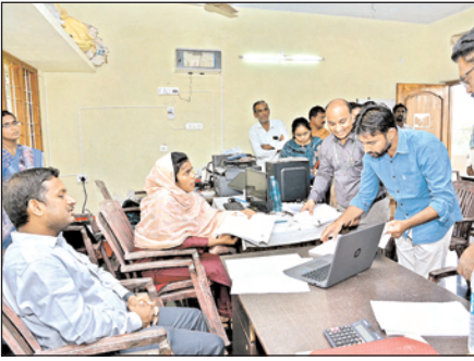
డేటా (సభ్యత్వం, డిపాజిట్లు, భూమి, పెట్టుబడులు, రుణాలు), డిసిటి సైన్ ఆఫ్, టి8