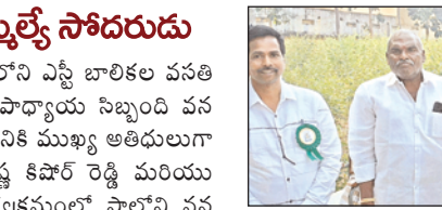
ఉపాధ్యాయ బృందం, విద్యార్థులు శాలువా వేసి ఘనంగా సన్మానించారు.