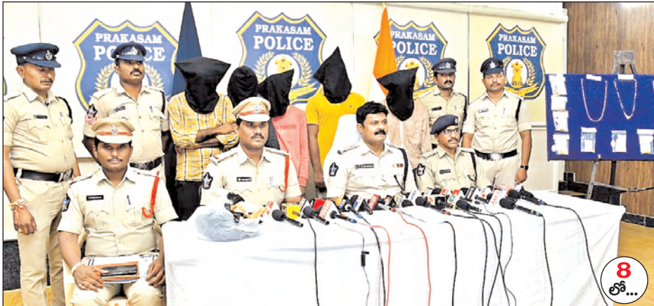
గంజాయి, చోలీ కేసుల్లో నిందితులు అరెస్టు