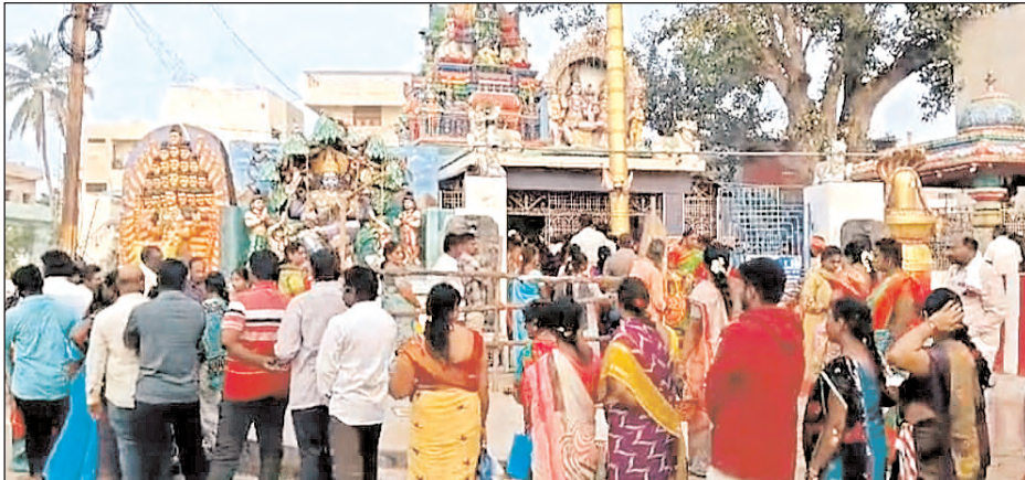
కార్తీక సోమవారం.. పోటెత్తిన భక్తజనం