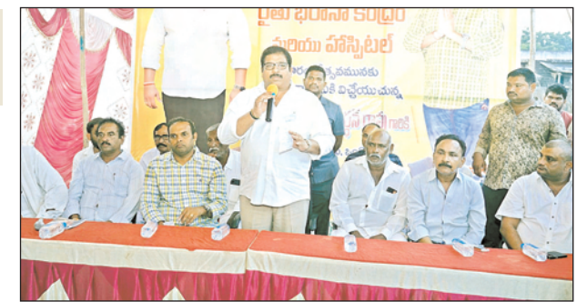
ఐక్యంగా గ్రామాల అభివృద్ధికి పాటుపడాలని సూచించారు. గ్రామ టిడిపి నాయకులు, సంబంధిత ఉద్యోగులు పాల్గొన్నారు.