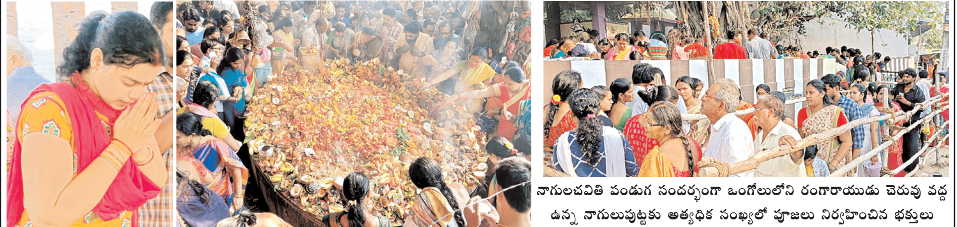
నాగులచవతి పండుగ సందర్భంగా ఒంగోలులోని రంగారాయుడు చెరువు వద్ద ఉన్న నాగులుపుట్టకు అత్యధిక సంఖ్యలో పూజలు నిర్వహించిన భక్తులు