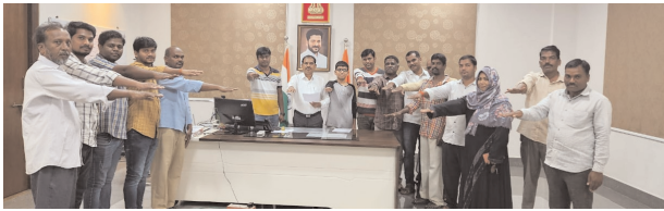
ప్రతిజ్ఞ చేస్తున్న అధికారులు