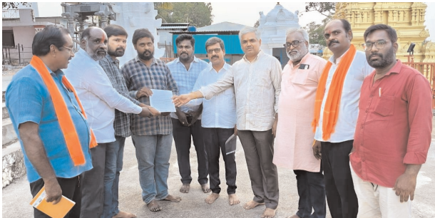
అధికారులకు వినతిపత్రం అందజేస్తున్న అనంతగిరి పరిరక్షణ సమితి సభ్యులు.

వికారాబాద్, మేజర్ న్యూస్ (నవంబర్ 01): ప్రతీ సంవత్సరం నిర్వహించే అనంతగిరి ప్రదక్షిణ కార్యక్రమాన్ని అనంత పద్మనాభ స్వామి ఆలయం తరపున దేవాదాయ శాఖ తరపున అధికారికంగా నిర్వహించాలని అనంతగిరి ఆలయ పరిరక్షణ సమితి, గిరిప్రదక్షిణ కమిటీ ఆధ్వర్యంలో స్థానిక ఈడ, మునిసిపల్ అధికారులకు వినతి పత్రం అందజేశారు. ఈ సందర్భంగా వారు మాట్లాడుతూ... ప్రతీ సంవత్సరం జరిగే జాతర ఉత్సవాలకు భక్తులు లక్షల సంఖ్యలో హాజరు అవుతారని చెప్పారు. భక్తులకు కనీస సౌకర్యాలైన మంచినీరు మరుగు దోడ్లు తదితర వసతులు లేక భక్తులు ఇబ్బందులకు గురవుతున్నారని చెప్పారు. దూర ప్రాంతాల నుండి వచ్చే భక్తులకు దేవస్నానం తరపున అన్నదానం చేయాలని కోరారు. అదేవిధంగా అసాంఘిక కార్యకలాపాలు జరగకుండా బండ్లబంస్తు సిబ్బందిని పెంచాలని కోరారు. ఈ కార్యక్రమంలో అనంతగిరి పరిరక్షణ సమితి