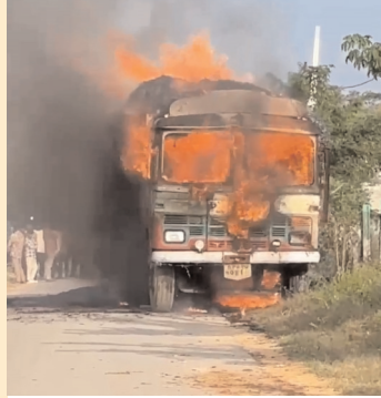
ప్రమాదానికి గురైన సొప్పలారీ, ప్రమాదంలో కాలిపోయిన పశుగ్రాసం