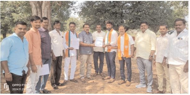
జిల్లేడ్ చౌదరిగూడ, నవంబరు 21 (మేజర్ న్యూస్): రాజోయే స్థానిక సంస్థల ఎన్నికల్లో మండలంలో భారతీయ జనతా పార్టీ అభ్యర్థులను గెలపించి సత్తా చాటులని అందుకోసం పార్టీ చేపట్టిన సభ్యత్వ సమోద కార్యక్రమాన్ని అన్ని గ్రామాలలో అధిక సంఖ్యలో సభ్యులను చేర్పించి పార్టీని పటిష్టం చేయాలని