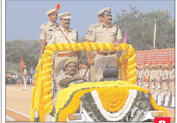
వికారాబాద్ జిల్లా ప్రతినిధి, మేజర్ న్యూస్ (నవంబర్ 21): 3లో