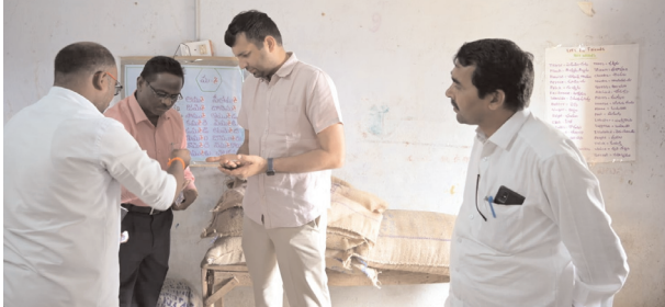
బియ్యాన్ని పరిశీలిస్తున్న జిల్లా కలెక్టర్ ప్రతీకజ్ఞెన్