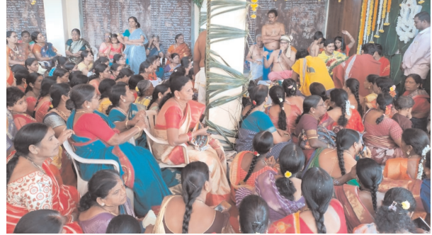
రుక్మిణి పాండురంగా స్వామి కళ్యాణ మహోత్సవంలో పాల్గొన్న భక్తులు.