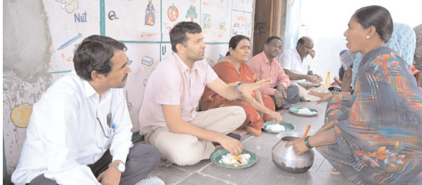
మధ్యాహ్న భోజనం చేస్తున్న జిల్లా కలెక్టర్, అధికారులు