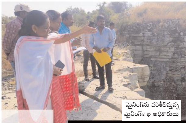
మైనింగ్ పరిశీలిస్తున్న మైనింగ్ శాఖ అధికారులు