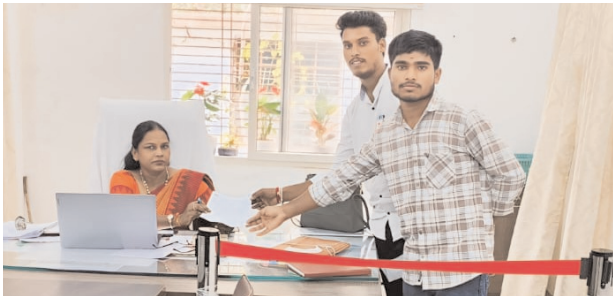
ఫరూఖ్ నగర్, మేజర్ న్యూస్ (నవంబరు 05): నిబంధనలు పాటించకుండా విద్యార్థులను ఇబ్బందిపాలు చేస్తున్న వార్డెన్లపై కఠినంగా వ్యవహరించాలని, అదేవిధంగా సంక్షేమ హాస్టల్లో వసతులను కల్పించాలని కోరుతూ ఏఐఎస్ఎఫ్