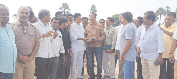
అండర్ గ్రౌండ్ డ్రైనేజీ నిర్మాణానికి స్థల పరిశీలనలో అధికారులు, కాంగ్రెస్ నేతలు

కాంగ్రెస్ సీనియర్ నేత సూధిని కొండల్ రెడ్డిలతో కలిసి స్థలపరిశీలన చేసిన పి.ఆర్ డిఇఇ, ఏఇలు