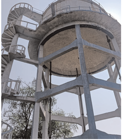
మిషన్ భగీరథ వాటర్ ట్యాంక్

దోమ, మేజర్ న్యూస్ (నవంబర్ 07): అధికారుల నిర్లక్ష్యంతో కాలనీ వాసులకు త్రాగు నీటి తిప్పలు తప్పడం లేదు. పలు మార్లు నీరు రావడం లేదని అధికారులకు విన్నవించినా పట్టించుకోవడం లేదని కాలనీ వాసులు వాపోతున్నారు. వికారాబాద్ జిల్లా దోమ మండల కేంద్రంలోని ఇందిరమ్మ కాలనీలో గత కొన్ని రోజులుగా నీటి అవస్థలు కాలనీ వాసులు ఎదుర్కొంటున్నారు. తొంభై వేయిల నీటి నిల్వ సామర్థ్యం గల మిషన్ భగీరథ ట్యాంక్ ఉన్నప్పటికీ సుమా