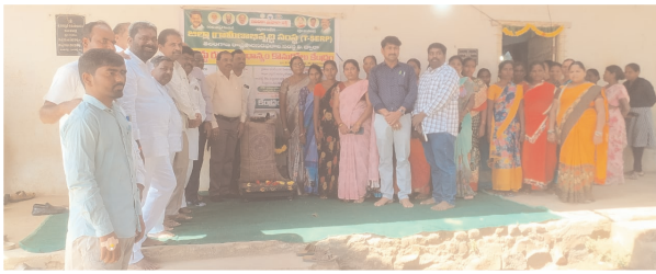
సాల్వీడ్ గ్రామంలో పరిధాన్యం కొనుగోలు కేంద్రాలు ప్రారంభిస్తున్న నాయకులు