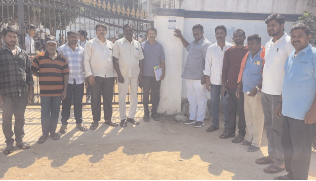
కడ్రాల్, మేజర్ న్యూస్ (నవంబర్ 07) : తెలంగాణ ప్రభుత్వం అన్నివర్గాలకు సామాజిక,