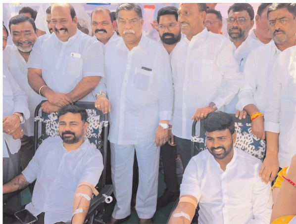
రక్తదానం చేస్తున్న కాంగ్రెస్ నాయకులు