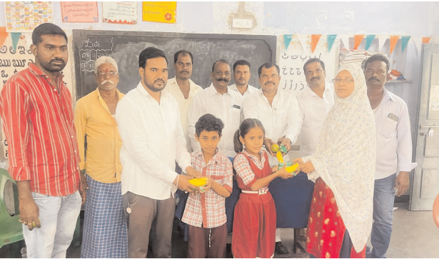
ఘట్టేసర్, మేజర్ న్యూస్(నవంబర్, 08):