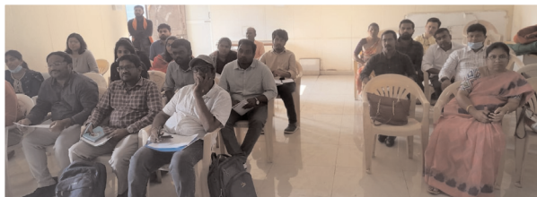
సమావేశంలో పాల్గొన్న వైద్య సిబ్బంది.