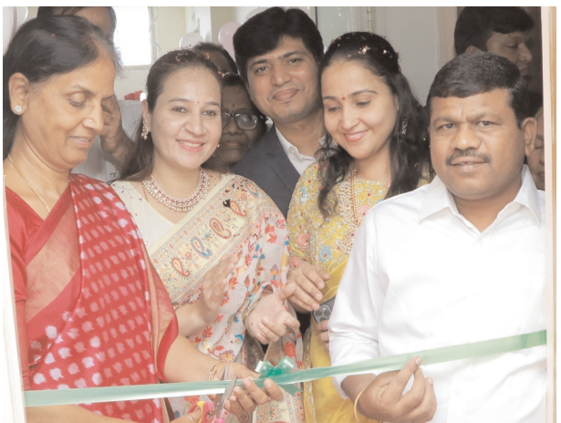
బాలాపూర్ మేజర్ న్యూస్ ( నవంబర్ 08): సూతనంగా చౌహాన్ హాస్పిటల్ లో ప్రివెంట్ బ్రెస్ట్ క్యాన్సర్ బ్లాక్ ను శుక్రవారం పలువురు నేతలతో కలిసి స్థాపన