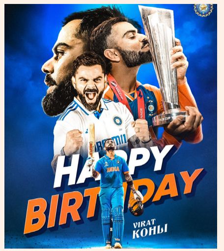
రన్ మెషిన్ విరాట్ కోహ్లి 36వ పుట్టినరోజు