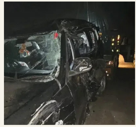
రోడ్డు ప్రమాదంలో నలుగురు డాక్టర్లు మృతి

ఓడిపోయినప్పుడు మాత్రమే నాయకులు ఈవీఎంల ట్యాంపరింగ్ గురించి మాట్లాడుతారు ప్రపంచవ్యాప్తంగా చాలా దేశాలు బ్యాలట్ పేపర్ ద్వారా ఎన్నికలు నిర్వహిస్తున్నందున భారత్ లోనూ ఈవీఎంల స్థానంలో బ్యాలట్ పేపర్ను పునఃప్రవేశపెట్టేలా ఉత్తర్వులు జారీ చేయాలని కోరుతూ దాఖలు చేసిన ప్రజాప్రయోజన వ్యాజ్యాన్ని సుప్రీంకోర్టు కొట్టిేసింది. ఓడిపోయినప్పుడు మాత్రమే నాయకులు ట్యాంపరింగ్ గురించి మాట్లాడుతున్నారు.. గెలిచినప్పుడు ఎవ్వరూ ట్యాంపరింగ్ జరిగిందని మాట్లాడటంలేదని సుప్రీంకోర్టు వ్యాఖ్యానించింది. మనం మిగతా ప్రపంచానికి ఎందుకు భిన్నంగా ఉండకూడదు.. బ్యాలట్ పేపర్లో జరిగితే ఏంటి? ఈవీఎంలతో జరిగితే ఏంటి? మనం మళ్లీ బ్యాలట్ వైపు మళ్లితే అవినీతి పోతుందని ఎలా చెబుతారని ప్రశ్నించిన కోర్టు.