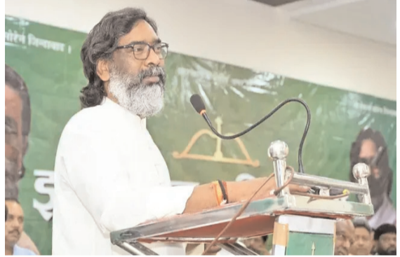
సంతో గిరిజనులే తలుస్తారు. జేఎంఎంఈ ఈ ప్రాంతం కరువుకొట్ట కావడంతో పాటు ఈసారి రక్త సంబంధీతుల మధ్య పోటీ నెలకొనడం ఆనందకరంగా మారింది.

ఎప్పుడీ చేయలేను" అని హేమంత్ సోరెన్ పేర్కొన్నారు. "బిహార్, ఛత్తీస్ గఢ్, ఒడిశా, బెంగాల్ నుంచి కొందరిని ప్రచారానికి తీసుకొచ్చింది. వారితో నాకు వ్యతిరేకంగా మాట్లాడింది. ఓటర్లను ఆందోళనకు గురిచేసేందుకు ప్రయత్నించింది. ఇప్పటి భాజపా అధికారం, ఇందుకోసం ఒక్క నియోజకవర్గంలోనే రూ.కోటికి పైగా ఖర్చు చేసింది. ఇతర రాష్ట్రాల నుంచి వచ్చినవారు ప్రచారం చేయకుండా అసత్యాల మాట్లాడారు. ఎన్నికల బాండ్లు, నకిలీ ఔషధాలు, నకిలీ వాక్విన్లతో మేము ప్రజల జీవితాలతో ఆడుకోలేదు" అంటూ భాజపాపై ఆరోపణలు చేశారు. కాగా.. రూర్ఖండ్లో తొలివిధత పోలింగ్ ముగిసిన సంగతి తెలిసిందే. మొత్తం 81 స్థానాలు ఉండగా.. తొలివిధతలో భాగంగా ఇటీవల 43 స్థానాలకు ఎన్నికలు జరిగాయి. మరో 38 సీట్లకు నవంబరు 20న పోలింగ్ జరగనుంది. వీటిలో 18 సీట్లలో ఫలితాలను