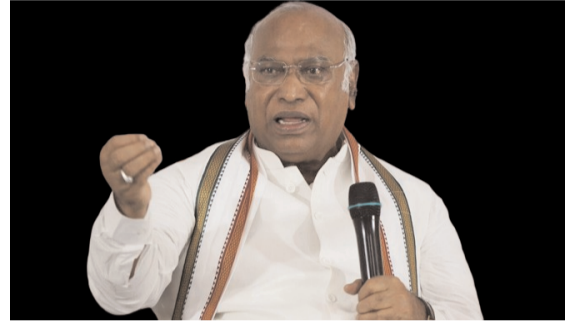
తీరును కూడా ఆమె తప్పింపట్టారు. మూడో సారి ఎన్నికైన తర్వాత ప్రధాని మోడీ అన్ని రాష్ట్రాల్లోనూ పర్యటిస్తున్నారని, కానీ, మణిపుర్ ఎందుకు రావడం లేదని ప్రశ్నించారు. ప్రజాస్వామ్యార్థంగా ఎన్నికైన ప్రధాని.. అన్ని రాష్ట్రాలను సమాన దృష్టితో చూడాలన్నారు. మోడీ జోక్యం చేసుకుంటేనే మణిపుర్ సంగోభానికే పరిష్కారం లభిస్తుందని చెప్పారు.

మణిపుర్ ప్రజలు ప్రశాంత వాతావరణంలో జీవించే సాగించగలుగుతారని లేఖలో పేర్కొన్నారు. మణిపుర్ సీఎం రాజీనామా చేయాలి: ఇతోమే వర్మి రాష్ట్రంలో శాంతిభద్రతలు పునరుద్ధరించడంలో సీఎం బీరేన్ సింగ్ విఫలమయ్యారని పౌరహక్కుల నేత, మణిపుర్ ఉక్తు మహిళ ఇతోమే వర్మి ధ్వజమెత్తారు. రాష్ట్రంలో నెలకొన్న పరిస్థితులకు బాధ్యత వహిస్తూ.. వెంటనే ఆయన రాజీనామా చేయాలని డిమాండ్ చేశారు. రాష్ట్ర ప్రజల ఆకాంక్షను ధృవీకరించుకొని, ఇక్కడ సమస్యల పరిష్కారం కోసం ప్రజాభిప్రాయ సేకరణ చేపట్టాలని కేంద్రానికి విజ్ఞప్తి చేశారు. ఈ మేరకు ఓ జాతీయ వార్తా సంస్థకు ఇచ్చిన ఇంటర్వ్యూలో ఆమె స్పష్టం చేశారు. రాష్ట్రంలో శాంతి పునరుద్ధరించాలని అవసరాన్ని ఆమె నొక్కి చెప్పారు. మరోవైపు కేంద్రం