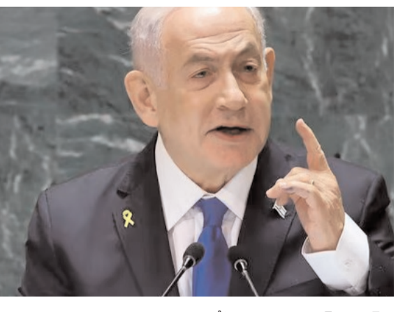
నెతన్యాయు గుర్తుతెచ్చుకొన్నారు. "గాజాలోకి వెళ్ళొద్దన్నారు.. ఖాస్ యూనిస్ పై అడుగు పెట్టొద్దన్నారు. ఇరాన్ రహస్యే దాడి చేసిన తర్వాత ప్రతిపక్షాలు వ్యతిరేకించారు. ఒకవేళ అమెరికా మాటలను కాదని వెల్లడితే ఒంటరిగా పోరాడాలి ఉంటుంది" అని చెప్పారు. కీలక ఆయుధ సరఫరాలను అవుతామని కూడా హెచ్చరించారు. అప్పంతో పని చేశారు" అని నెతన్యాయు అసంతృప్తి వ్యక్తం చేశారు. తామే సాతకంగా పోరాడాలని అమెరికా విదేశాంగ మంత్రి బ్లింకెన్ కు వెల్లడించినట్లు కూడా చెప్పారు.

ఇరాన్ ఇరాన్ అణు కార్యక్రమంలో భాగంగా కీలక పరికరాలు తయారుచేసే స్థావరాలపై తాము అక్టోబర్లోనే దాడి చేసినట్లు ఇజ్రాయెల్ ప్రధాని నెతన్యాయు అంగీకరించారు. ఈ విషయాన్ని ఆయన దేశ పార్లమెంటులో వెల్లడించారు. తాము వాటిని ధ్వంసం చేశాం.. ఇజ్రాయెల్ అణు కార్యక్రమం ఆగలేదని ఆయన పేర్కొన్నారు. ఇక ఏప్రిల్లో తాము చేసిన దాడిలో బిల్డింగ్ చుట్టూ మోహరించిన మూడు ఎన్-300 బ్యాలిస్టికల్ ధ్వంసం చేశామని నెతన్యాయు తెలిపారు. మరో మూడు బ్యాలిస్టికల్ ఆ దేశం వద్ద మిగిలిఉండగా.. అక్టోబర్లో చేసిన దాడిలో వాటిని కూడా ధ్వంసం చేశామన్నారు. ఆ దేశ సమయంలో క్షిపణుల్లో వాడే ఘన ఇంధన తయారీ కేంద్రాన్ని కూడా పేల్చేశామన్నారు. వీటికి ఇరాన్ ప్రతి దాడులు చేస్తుంది అంటూనే అవసరమైన ప్రతిపాదనలను ఇజ్రాయెల్ సిద్ధం చేసింది. "ఇరాన్ అణు కార్యక్రమాన్ని పట్టించుకోకపోతే.. మిగిలిన సమస్యలు మొత్తం పునరావృతం అవుతాయి. ఇరాన్ సమస్యను సంస్థలు మరోసారి బలోపేతమే.. ఇజ్రాయెల్ పై దాడులకు దిగుతాయి" అని నెతన్యాయు పేర్కొన్నారు. అందుకే ఇరాన్.. అణుసామర్థ్యాన్ని సంతరించుకోకుండా చూడటం చాలా ముఖ్యం అని చెప్పారు.