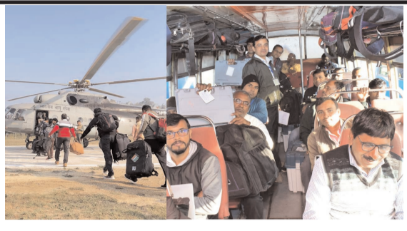
13వ 43 స్థానాలకు పోలింగ్ జరిగింది. మిగతా స్థానాలకు బుధవారం జరగనున్నాయి. ఎన్నికల ఫలితాలు మాత్రం నవంబర్ 23న విడుదల కానున్నాయి. ఇక ఎగ్జిట్ పోల్లీ మాత్రం ఓటింగ్ ముగిసిన తర్వాత వెలువడనున్నాయి.

వేసేందుకు తరలి రావాలని ఈసీ విజ్ఞప్తి చేసింది. మరోవైపు ఆయా ప్రాంతాల్లో ఉంటున్న మహారాష్ట్ర వాసులంతా ఓటు వేసేందుకు స్వస్థలాలకు తరలివెళ్తున్నారు. దీంతో రైళ్లు, బస్సులు, సౌకం వాహనాలు కిక్కిరిసి వెళ్తున్నాయి. మరోవైపు ఇండియన్ రైల్వే కూడా ప్రత్యేక రైళ్లు నడుపుతోంది. మొత్తం దారులన్నీ మహారాష్ట్ర, జార్ఖండ్ వైపు వెళ్తున్నాయి. మహారాష్ట్రలో 288 అసెంబ్లీ స్థానాలు ఉన్నాయి. బుధవారం ఒక్కరోజే ఒకే విధతలో పోలింగ్ జరుగుతోంది. ఇక జార్ఖండ్లో అయితే రెండు విధతల్లో పోలింగ్ జరుగుతోంది. మొత్తం 81 అసెంబ్లీ స్థానాలు ఉన్నాయి. తొలి విధత నవంబర్