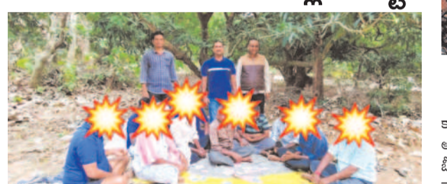
నెల్లిపర్తి, నవంబర్ 24, మేజర్ న్యూస్