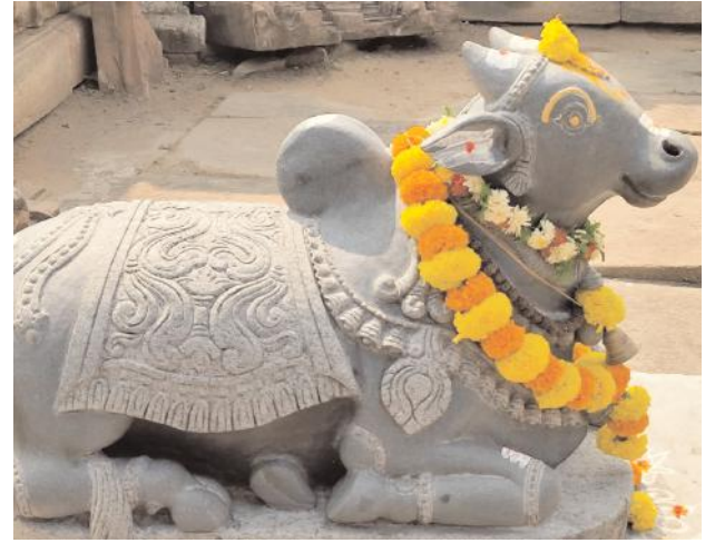
9100512458 సంప్రదించాలన్నారు. దీపోత్సవానికి నూనెను అందించే భక్తుల నామ గోత్రాలపై ప్రతిరోజూ సాయంత్రం పూజ కార్యక్రమం నిర్వహించడం జరుగుతుందని పరిరక్షణ కమిటీ తెలిపింది.