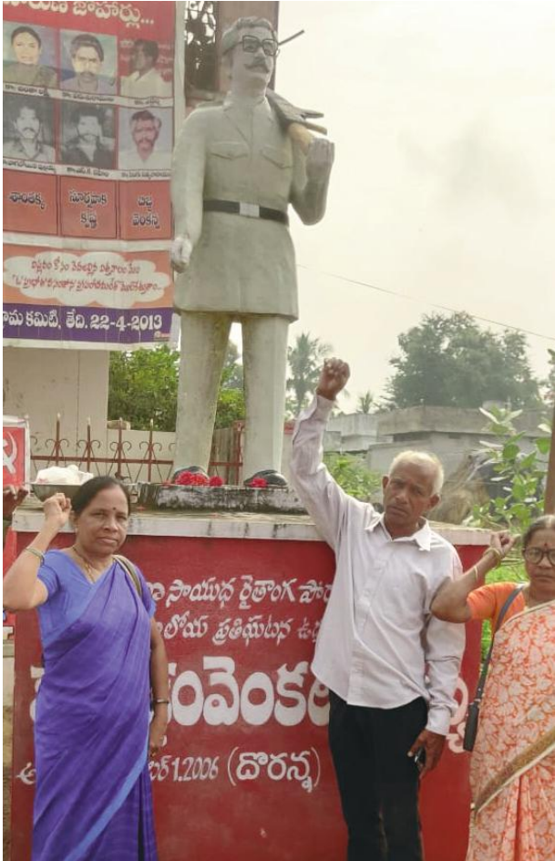
భూమి కోసం భుక్తి కోసం దేశ విముక్తి కోసం