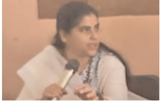
కుటుంబ సర్వేను పారదర్శకంగా నిర్వహించాలి

బెస్తం చెరువు సమీపంలో గుడిసెలు వేసుకున్న కాలనీలో చోటు చేసుకుంది. గుడిసె వేసుకోవడానికి స్థలం ఇస్తానని డబ్బులు తీసుకుని స్థలం ఇవ్వకుండా బెదిరిస్తున్నారని శుక్రవారం స్థానిక పోలీసులని ఆశ్రయించినట్లు సమాచారం. గత రెండు మూడు సంవత్సరాలుగా ఇంటి స్థలం ఇస్తానని చెప్పి వేళల్లో డబ్బులు వసూలు చేశారని స్థలం ఇవ్వకుండా బెదిరిస్తున్నట్లు బాధితులు ఆరోపిస్తున్నారు. స్థలం ఇచ్చిన వారికి ఇంటి నిర్మాణం కొరకు తనకు సంబంధించిన షాపులో రేకులు పైపులు ఇతర సామాగ్రి తీసుకోవాలని హుకుం జారీ చేసినట్లుగా చెబుతున్నారు. సామాగ్రి కోసం సైతం వేళల్లో డబ్బులు తీసుకొని సామాగ్రి ఇవ్వకుండా కాలయాపన చేస్తున్నారని ఇదేంటని అడిగితే బెదిరింపులు పాల్పడుతున్నట్లుగా బాధితులు ఆవేదన వ్యక్తం చేస్తున్నారు. ఏం చేయాలో అర్థం కాక పోలీస్ స్టేషన్లో ఫిర్యాదు చేసినట్లుగా బాధిత కాలనీవాసులు వాపోతున్నారు.