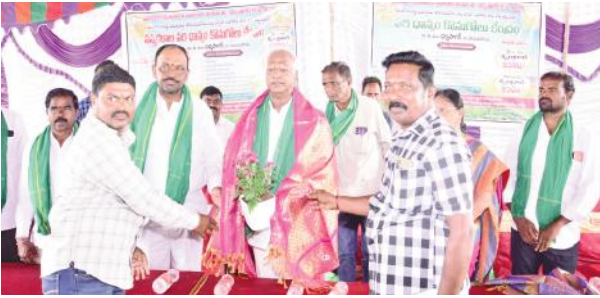
నవంబర్ 6 తేదీ నుంచి కుల గణన రాష్ట్రంలో సమగ్ర సర్వేకు అందరూ సహకరించాలి ధాన్యం కొనుగోలు కేంద్రాలను ప్రారంభించిన ఎమ్మెల్యే కడియం శ్రీహరి

ధర్మసాగర్ నవంబర్ 1 (మేజర్ న్యూస్) రైతుల సంక్షేమమే కాంగ్రెస్ ప్రభుత్వ లక్ష్యం అని మాజీ ఉప ముఖ్యమంత్రి స్టేషన్ ఘనపూర్ ఎమ్మెల్యే కడియం శ్రీహరి అన్నారు. ధర్మసాగర్ మండల కేంద్రంలో పిఎసిఎస్ ఆధ్వర్యంలో ధాన్యం కొనుగోలు కేంద్రాన్ని ప్రారంభించిన సందర్భంగా ఆయన మాట్లాడారు. రైతులు పండించిన ధాన్యం బివరి గింజ వరకు కొనుగోలు చేస్తామని అన్నారు. రైతులు పండించిన ధాన్యాన్ని కొనుగోలు కేంద్రాల్లోనే విక్రయించాలన్నారు. ధాన్యం ఏ గ్రేడ్ 2,320, బీ గ్రేడ్ 2,300, సన్నరకానికి అదనంగా 500 బోనస్ చెల్లిస్తామన్నారు. రైతులందరూ ఈ అవకాశాన్ని సద్వినియోగం చేసుకోవాలని కోరారు. రైతులకు 2 లక్షల ఏకకాలంలో రుణమాఫీ చేసిన ఘనత సీఎం రేవంత్ రెడ్డి గారికే దక్కుతోందన్నారు. గత ప్రభుత్వాలు ప్రభుత్వపరంగా రావాల్సిన సబ్సిడీలను అందించలేదని విమర్శించారు. గత బీఆర్ఎస్ ప్రభుత్వం 7 లక్షల కోట్లు అప్పు చేసి, రాష్ట్ర ఆర్థిక పరిస్థితిని దివాలా తీయించిందన్నారు. ఓ వైపు బీఆర్ ఎస్ చేసిన అప్పులకు వడ్డీలు కడుతూనే, మరో వైపు సంక్షేమ, అభివృద్ధి కార్యక్రమాలను చేపడుతున్నారని స్పష్టం చేశారు. దేశంలో ఎక్కడ లేని విధంగా కాంగ్రెస్ ప్రభుత్వం అధికారంలోకి వచ్చిన