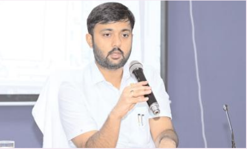
నవంబర్ 2న బీసీ కమిషన్