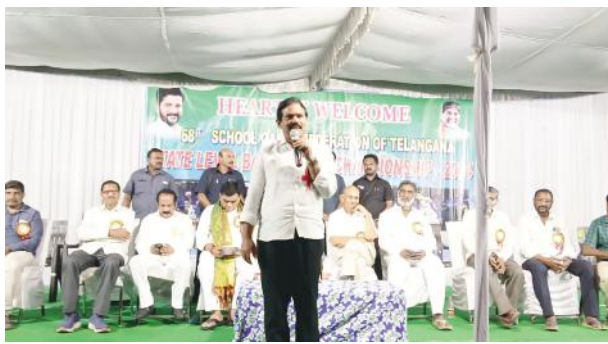
పాల్గొననున్న ఉమ్మడి పది జిల్లాల 20 జిల్ల 300 మంది క్రీడాకారులు, 200 మంది అధికారులు మహబూబాబాద్ జిల్లా కేసముద్రంలో మూడు రోజుల పాటు నిర్వహణ

ఎమ్మెల్యే మురళీ నాయక్ ముఖ్య అధితులుగా పాల్గొన్న ఎమ్మెల్యే, ఎంపీ, ఎమ్మెల్సీ, మార్కెట్ కమిటీ చైర్మన్ రాష్ట్ర స్థాయి క్రీడా పోటీలు ప్రారంభం స్కూల్ గేమ్స్ ఫెడరేషన్ పోటీలు అండర్ 17 అండ్ 19 విభాగంలో బాస్కెట్ బాల్, ఉప్పు పోటీలు