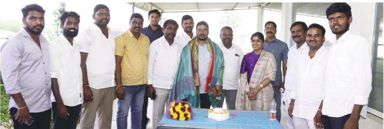
- నల్ల శ్రీరాములుకు జన్మదిన