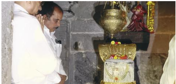
కుడా చైర్మన్ ఇనగాల