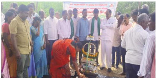
ప్రభుత్వం అందించే 500 రూ., బోనస్ పొందాలి