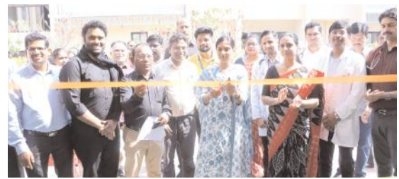
కలెక్టరేట్ లో మెడికవర్ ఆసుపత్రి ఆధ్వర్యంలో