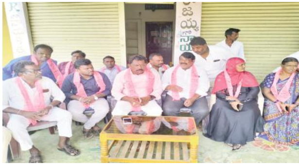
జాయింట్ సర్వేలు గతంలోనే చేసి పెట్టారు

ఇనుప రాతి గుట్టలు ప్రభుత్వ ఆస్తి కాదు అన్నవారికి