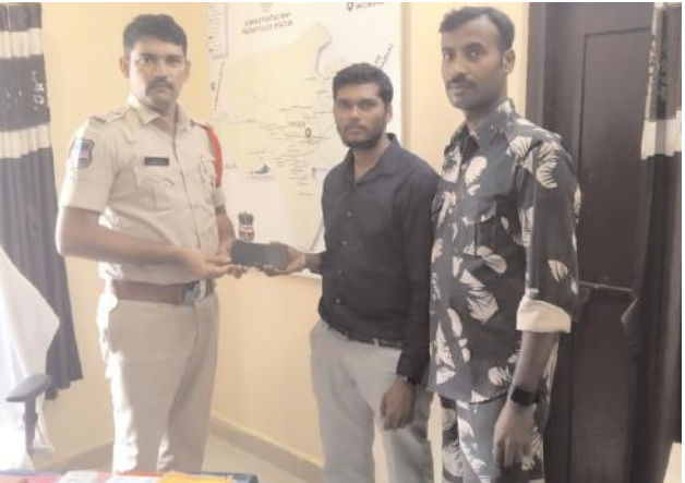
గోవిందరావుపేట, నవంబర్ 16 (మేజర్ న్యూస్ సూర్య) : అధునాతన సాంకేతికత అందుబాటులోకి వచ్చిన తర్వాత తాము పోగొట్టుకున్న మొబైల్ ఫోన్స్ తిరిగి సొంతమవుతున్నాయి. గతంలో మొబైల్ ఫోన్ పోతే ఆశలు