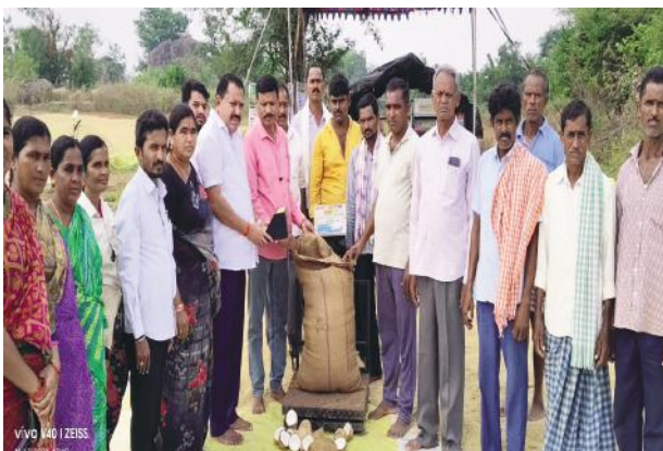
- రైతులు దళారులను నమ్మి మోసపోవద్దు