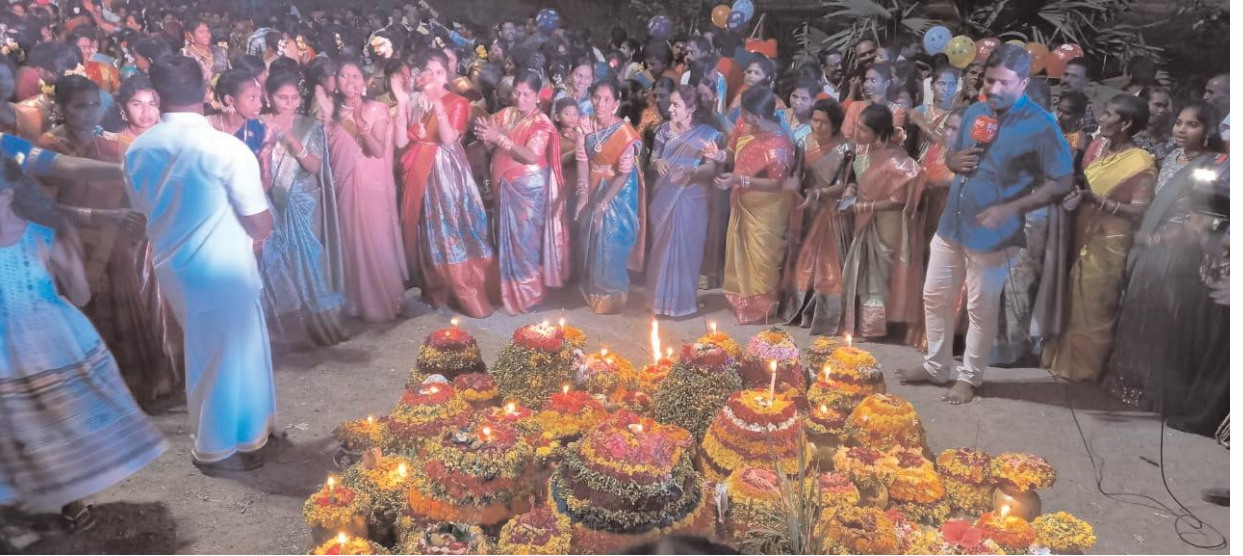
ముగిశాయి. ఈ కార్యక్రమంలో నేతకాని కుల సంఘం జిల్లా, రాష్ట్ర నాయకులు, ప్రజాప్రతినిధులు, స్థానికులు పాల్గొన్నారు.