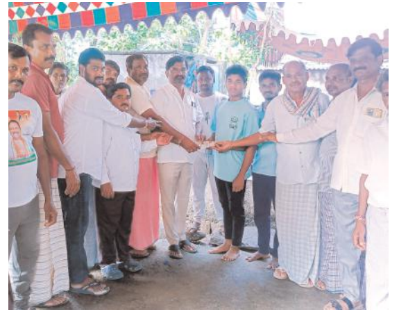
మృతుని కుటుంబానికి పరామర్శ