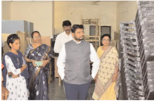
వారం రోజుల్లో పనులు పూర్తి చేయాలి