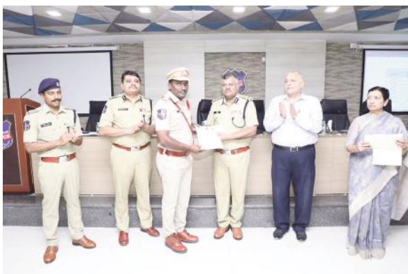
అత్యధిక కన్విక్షన్ రేట్ గా మహబూబాబాద్ జిల్లా