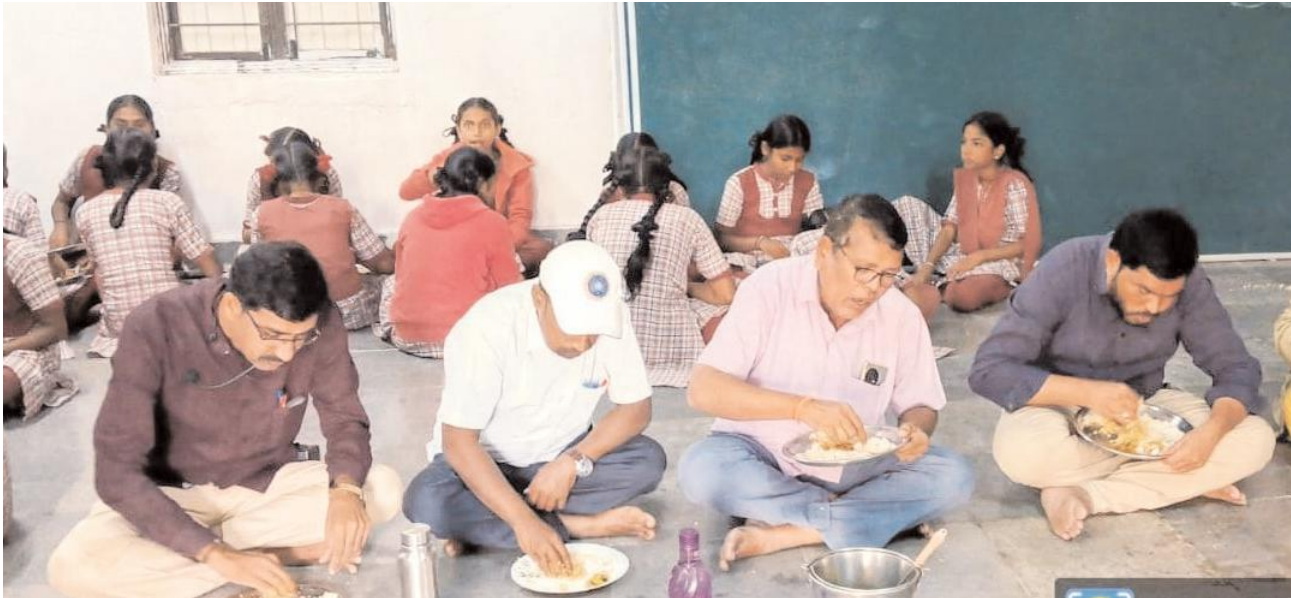
ఆహార నాణ్యతను ఉపాధ్యాయులు పరిశీలించాలి