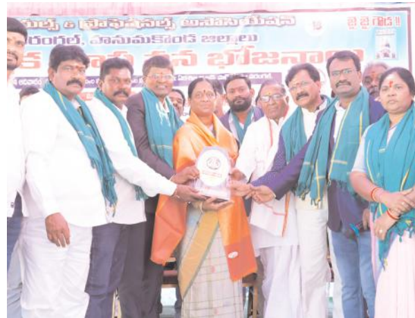
కార్యక్రమంలో గోపా సభ్యులు పాల్గొన్నారు.