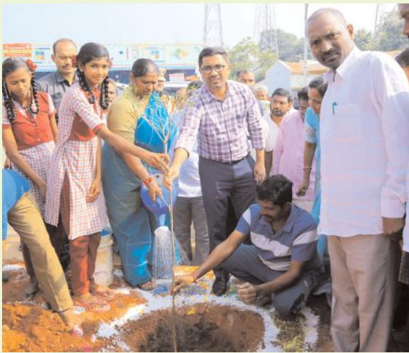
మొదటి పేజీ తరువాయి..

పంచాయతీరాజ్, గ్రామీణ అభివృద్ధి, స్త్రీ శిశు సంక్షేమ శాఖ : మంత్రి సీతక్క