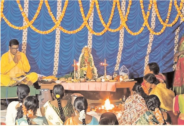
మైలారం హనుమాన్ దేవాలయంలో