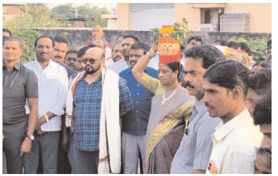
వంచనగిరిలో వైభవంగా పోచమ్మ బోనాలు బోనమెత్తిన మంత్రి కొండా సురేఖ