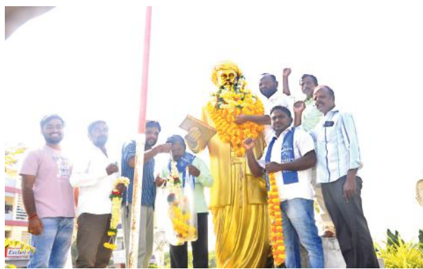
134వ వర్ధంతి సందర్భంగా బీసీ హక్కుల సాధన సమితి,