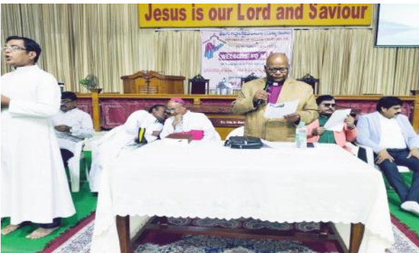
మేం పంచమాలం కాదు ఊరు బయట ఉండలేము