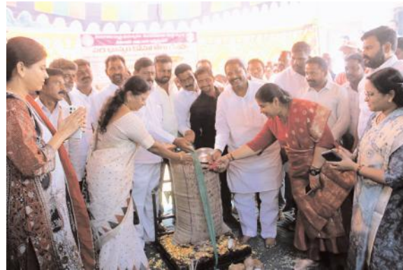
ప్రభుత్వం ఏర్పాటు చేసిన ధాన్యం కొనుగోలు కేంద్రంలో మాత్రమే రైతులు తమ పంటలను అమ్ముకోవాలని కోరారు. ఈ కార్యక్రమంలో జిల్లా సహకార

చెన్నారావుపేట పాత సాసైటీ ఆవరణలో ధాన్యం కొనుగోలు కేంద్రాన్ని నర్సంపేట ఎమ్మెల్యే దొంతి మాధవరెడ్డి జిల్లా కలెక్టర్ సత్య శారదతో కలిసి ప్రారంభించారు. రైతులు పండించిన పంటలను ఎలాంటి ఇబ్బందులు లేకుండా అమ్ముకోవడానికి ప్రభుత్వం ఏర్పాటు చేసిన ధాన్యం కొనుగోలు కేంద్రాలలో రైతులు పంటలను అమ్ముకోవాలని సూచించారు. రైతులు పంటలను మార్కెట్ కి తెచ్చే సమయంలో పంటలను ఆరబెట్టి తేవడం వల్ల ఎక్కువ ధర వస్తుంది కావున వరి పంటలను తేమ లేకుండా తీసుకొని రావాలని అన్నారు. రైతులు పండించిన ప్రతి గింజను ప్రభుత్వమే కొంటుందని