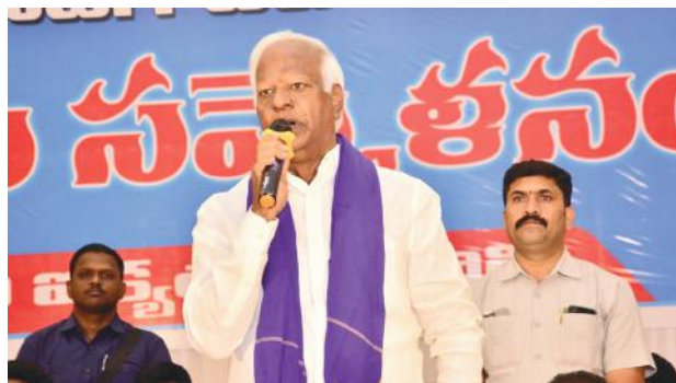
కెఎల్ఎన్ కన్వెన్షన్ లో మాదిగ, మాదిగ ఉపకులాల ఆత్మీయ సమ్మేళనం హాజరైన ఎంపీ డా. కడియం కావ్య, ఎమ్మెల్యే కడియం శ్రీహరి

హన్మకొండ ప్రతినీధి, నవంబర్ 04, మేజర్ న్యూస్ సూర్య:తెలంగాణ రాష్ట్రంలో వంద శాతం ఎస్సీ వర్గీకరణ జరుగుతుందని వరంగల్ పార్లమెంట్ సభ్యులు డా కడియం కావ్య, స్టేషన్ ఘనపూర్ శాసనసభ్యులు కడియం శ్రీహరి అన్నారు. భీమారం కెఎల్ఎన్ కన్వెన్షన్ లో మాదిగ, మాదిగ ఉపకులాల ఆత్మీయ సమ్మేళనం కార్యక్రమంలో ముఖ్య అతిథులుగా వరంగల్ పార్లమెంట్ సభ్యులు డా కడియం కావ్య, మాజీ ఉప ముఖ్యమంత్రి స్టేషన్ ఘనపూర్ శాసనసభ్యులు కడియం శ్రీహరి పాల్గొన్నారు. ఎంపీ డాక్టర్ కడియం