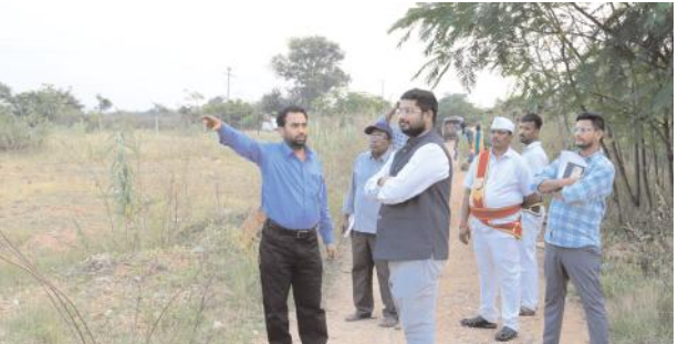
ఉండకూడదని, సర్వే నెంబర్ల వారిగా నివేదిక త్వరితగతిన అందజేయాలన్నారు.