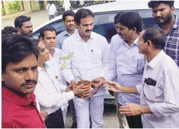
సమస్యల పరిష్కారానికి కృషి చేస్తా