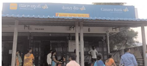
మంటలు అర్పడంతో ఎటువంటి నష్టం జరగలేదని లేకుంటే పెద్ద ప్రమాదం వాటిల్లేదని పలువురు ఖాతాదారులు అంటున్నారు. సిబ్బంది ప్రాణాలకు తెగించి మంటలు అర్పిన తీరుతుని చూసి పలువురు వారిని ప్రశంసిస్తున్నారు.

మంగపేట, నవంబర్ 4, సూర్య (మేజర్ న్యూస్): ములుగు జిల్లా మంగపేట మండలంలోని కెనరా బ్యాంకు రాజుపేట బ్రాంచ్ లో సోమవారం సాయంత్రం షాట్ సర్క్యూట్ తో మంటలు చెలరేగాయి. మేనేజర్ క్యాబిన్ లో ఉన్న ప్యాన్ లో షాట్ సర్క్యూట్ కారణంగా మంటలు రావడంతో బ్యాంకు సేవల కోసం వచ్చిన ఖాతాదారులు బయటకు పరుగులు తీశారు. వెంటనే గమనించిన బ్యాంకు సిబ్బంది చాకచక్యంగా వ్యవహరించి మంటలు అర్పడంతో పెను ప్రమాదం తప్పింది. బ్యాంకు సిబ్బంది సరైన సమయానికి ప్రాణాలకు తెగించి