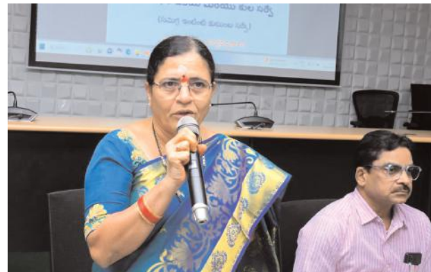
తెలిపారు. సర్వే జరిగిన ప్రతి ఇంటికి స్టికర్ అంటించాలని తెలిపారు. ఈకార్యక్రమంలో తహసీల్దార్లు, ఎంపీడిఓలు, ఎన్యూమరేటర్లు తదితరులు పాల్గొన్నారు.