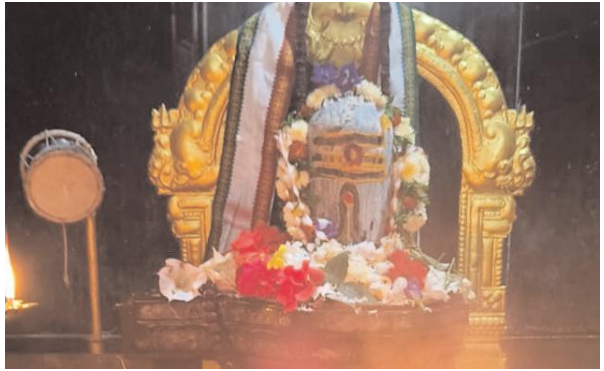
చెల్లించుకున్నారు. బిల్వార్చనలు, శివార్చనలు సాగాయి.