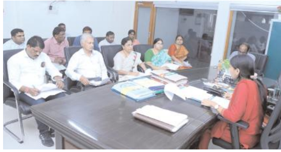
జిల్లాలో సజావుగా ధాన్యం కొనుగోలు ప్రక్రియ