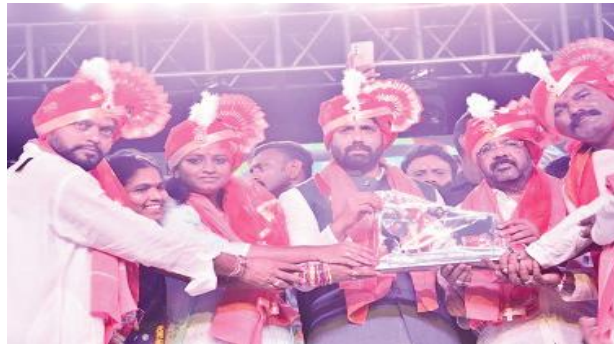
ప్రజలు పెద్ద ఎత్తున వస్తారని తెలిపారు.