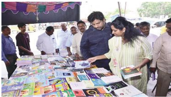
పుస్తక పఠనంతోనే ప్రపంచ విజ్ఞానం సాధ్యం వరంగల్ ఎంపి డాక్టర్ కడియం కావ్య