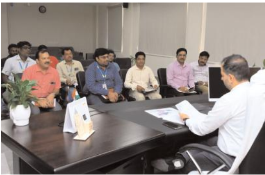
ఇంటర్నెట్ సేవలు గ్రామీణ ప్రాంతాలకు విస్తరించాలి జిల్లాలో నూరు శాతం సామరేషన్ మోడల్లో అంతర్జాల సేవలు అందించాలి జిల్లా కలెక్టర్ రాహుల్ శర్మ

ధాన్యం కొనుగోలు కేంద్రం ద్వారా కొనుగోలు చేసిన అనంతరం ధాన్యాన్ని వెంటనే తరలించేందుకు మిల్లుల ట్యాగింగ్ తో పాటు గోదాంల ట్యాగింగ్ కూడా చేసినట్లు పేర్కొన్నారు. జిల్లా వ్యాప్తంగా 154 ధాన్యం కొనుగోలు కేంద్రాలను ఏర్పాటు చేయగా వందకు పైగా ధాన్యం కొనుగోలు కేంద్రాల ద్వారా ధాన్యం కొనుగోలు చేపట్టినట్లు చెప్పారు. ధాన్యం కొనుగోలు కేంద్రాల వద్ద ప్యాడి క్లీనర్ లను ఏర్పాటు చేసినట్లు తెలిపారు. పెద్ద కేంద్రాలలో డ్రయ్యర్లను కొనుగోలు చేసేందుకు ఆదేశాలు ఇచ్చామని, డ్రయ్యర్ల ను ధాన్యం కొనుగోలు కేంద్రాల వద్ద అందుబాటులోకి తీసుకురావడం వలన నిబంధనల మేరకు మాయిశ్చర రావడానికి అవకాశం ఉన్నందున ఈసారి ధాన్యం కొనుగోలు కేంద్రాలలో వీటిని వినియోగిస్తున్నట్లు తెలిపారు. సన్న రకం ధాన్యానికి ప్రభుత్వం ప్రకటించిన బోనస్ రూ. 500లు ఓపీఎంఎస్ ట్యాబ్ ఎంట్రీ అయిన వెంటనే సంబంధిత రైతుల ఖాతాల్లో నేరుగా జమ అవుతాయని పేర్కొన్నారు. సన్న రకం ధాన్యానికి సంబంధించిన బోనస్ విషయంలో ఎలాంటి అనుమానాలు, అపోహలకు పోవద్దన్నారు. హనుమకొండ జిల్లాలో కమలాపూర్, ఎల్కెఆర్, ధర్మసాగర్, వేలేరు మండలాల్లో చాలావరకు వరి కోతలు పూర్తయ్యాయని, ఈ మండలాల నుండే ఎక్కువ ధాన్యం వస్తుందన్నారు. ధాన్యం కొనుగోలు ప్రక్రియకు సంబంధించి వర్తవేక్షణ చేస్తున్నట్లు తెలిపారు. వరి కోతలు పూర్తి చేసుకుని ముమ్మరంగా ధాన్యం రానున్న నేపథ్యంలో ధాన్యం కొనుగోలు సమర్థవంతంగా నిర్వహించేందుకు అన్ని ఏర్పాట్లను పూర్తి చేసినట్లు వివరించారు. కార్యక్రమంలో డిఆర్డిఎ నాగ పద్మజ, తహసీల్దార్ జగత్ సింగ్, వ్యవసాయ, డిఆర్డిఎ అధికారులు పాల్గొన్నారు.