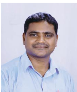
నవంబర్ 7 నుంచి జరిగే చెకుముకి సంబురాలను జయప్రదం చేయండి జన విజ్ఞాన వేదిక ఆధ్వర్యంలో ఏర్పాటు పూర్తి