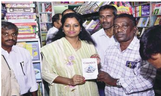
హన్మకొండ ప్రతినిధి, నవంబర్ 06, మేజర్ న్యూస్ సూర్య:శాస్త్ర సాంకేతిక పరిజ్ఞానం ఎంత పెరిగినా పుస్తక పఠనంతో వచ్చే జ్ఞానం శాశ్వతం అని వరంగల్ ఎంపీ డా. కడియం కావ్య అన్నారు. జాతీయ పుస్తక వారోత్సవాలు,

బాలల దినోత్సవం సందర్భంగా హనుమకొండ అశోకా కాంప్లెక్స్ లో ఏర్పాటు చేసిన నవచేతన పుస్తక ప్రదర్శనను ఎంపి డాక్టర్ కడియం కావ్య దంపతులు ముఖ్య అతిథిగా హాజరై ప్రారంభించారు. ఈ సందర్భంగా ఎంపీ మాట్లాడుతూ పుస్తక పఠనంతోనే ప్రపంచ విజ్ఞానం సాధ్యమవుతుందని అన్నారు. పుస్తకాలు విజ్ఞాన నేస్తాలని, సాంకేతికత ఎంతగా పెరిగినా పుస్తకాలకు ఉన్న ప్రాధాన్యత తగ్గలేదని అన్నారు. తల్లిదండ్రులు తమ పిల్లలను, ఉపాధ్యాయులు తమ విద్యార్థులను పుస్తకాలు చదివేలా ప్రోత్సహించాలని, పుస్తక పఠనం పెరగడం ద్వారా మెరుగైన, ఆరోగ్యవంతమైన సమాజ నిర్మాణం సాధ్యమవుతుందని చెప్పారు. ప్రముఖ ప్రచురణ సంస్థలకు చెందిన అనేక రకాల పుస్తకాలు, ప్రపంచంలో పేరుపొందిన గొప్ప రచయితల పుస్తకాలు ఈ పుస్తక ప్రదర్శనలో అందుబాటులో ఉంచారని, ప్రత్యేక తగ్గింపు ధరలతో వీటిని పాఠకులకు అందించడం అభినందనీయమని అన్నారు. పుస్తక ప్రియులు, విద్యార్థులు, విద్యాసంస్థలు, గ్రంథాలయాలు ఈ అవకాశాన్ని సద్వినియోగం చేసుకోవాలన్నారు. ఈ కార్యక్రమంలో స్థానిక ప్రజాప్రతినిధులు, నాయకులు, పుస్తక ప్రేమికులు పాల్గొన్నారు.