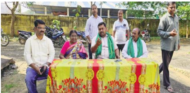
పక్క మార్కెట్ గుమస్తాల్లాగా పని చేయకండి!