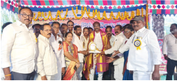
- ఎమ్మెల్యే బడేటి చంటి ప్రశంస

ఏలూరు,మేజర్స్ న్యూస్: సందర్భమేదైనా సంఘీయులంతా ఐక్యత చాటడం ఎంతో ఆదర్శనీయమని ఎమ్మెల్యే బడేటి రాధాకృష్ణయ్య (చంటి) కొప్పుల వెలమ సంఘీయులను ప్రశంసించారు. దెందులూరు మండలం గోపన్నపాలెంలో ఆదివారం ఏలూరు పట్టణ కొప్పుల వెలమ కుల సంఘం ఆధ్వర్యంలో కార్తీక వనసమారాధన కార్యక్రమం అట్టహాసంగా నిర్వహించారు. భారీ సంఖ్యలో సంఘీయులు ఈ కార్తీక సమారాధనలో పాల్గొనడంతో వేదిక సందడిగా మారింది. ఆటలు,పాటలతో ఉత్సాహంగా సాగింది. ఎమ్మెల్యే మాట్లాడుతూ 2024 ఎన్నికల్లో 90 శాతం కంటే పైనే కొప్పుల వెలమ సంఘీయులందరూ తెలుగుదేశంపార్టీకి అండగా నిలిచారన్నారు. తాను అధికారంలోకి వచ్చిన అనంతరం దశలవారీగా హామీల అమలుకు కృషిచేస్తున్నామన్నారు. కొప్పుల వెలమ కళ్యాణ మండపం నిర్మాణానికి సముచితమైన స్థలాన్ని కేటాయిస్తానన్నారు. అర్హులకు పథకాల వర్తింపులో కూడా ప్రాధాన్యత కల్పిస్తామన్నారు. ప్రతి ఏడాది కార్తీక వన సమారాధనలో ఆత్మీయంగా సంఘీయులంతా ఐక్యత చాటడం ఎంతో