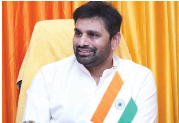
డిప్లీ/ ఏలూరు,సూర్య జ్యూరీ: కూటమి ప్రభుత్వం 2024-2025 ఆర్థిక సంవత్సరానికి రూ.2.94 లక్షల కోట్లతో పూర్తిస్థాయి వార్షిక బడ్జెట్