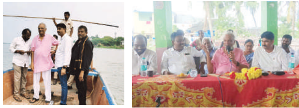
చూపిస్తూ కొల్లేరు ప్రజల జీవితాలను అస్తవ్యస్తం చేస్తున్నారని విమర్శించారు.

బుడమేరు ముఖ ద్వారం నుండి ఉప్పులేరు వరకు కాలువలు పూడుకుపోయి నీటిపారుదల సౌకర్యం లేక వరదలు వచ్చినప్పుడు లంక గ్రామాలు నీట మునిగి ప్రజల జీవితాలు చిన్నాభిన్నం అవుతున్నాయని ఆవేదన వ్యక్తం చేశారు. రాష్ట్ర ప్రభుత్వం తక్షణం పూడిక తీసి,అక్రమణలు తొలగించి లంక ప్రజల జీవితాలను మెరుగుపరచాలని డిమాండ్ చేశారు.పాలకులు ప్రభుత్వాలు ఓట్ల కోసం కాకుండా, పదవులపై వ్యామోహం లేకుండా ప్రజల కోసం పనిచేయాలని సూచించారు.కూటమి ప్రభుత్వం యుద్ధ ప్రాతిపదికన లంక గ్రామాలలో మెరుగైన రవాణా సౌకర్యాల కోసం రహదారులు నిర్మించాలని డిమాండ్ చేశారు.పాలకులు చేపల చెరువులో అక్రమంగా తవ్వి సాగు చేసుకున్న మాఫియాను అడ్డుకోకుండా కేవలం రాజకీయ ప్రత్యర్థుల పైన మాత్రమే తమ ప్రతాపం