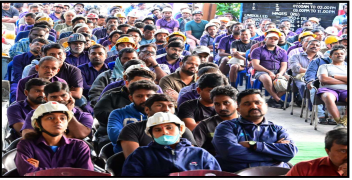
సాధించడానికి చేయాల్సిన పనులపై కార్మికులకు