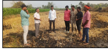
అన్నారు. మండలంలోని కూచన పల్లి గ్రామంలో వరి