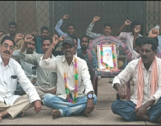
శుక్రవారం స్థానిక ఎంపీడీవో కార్యాలయం ముందు టోకెన్ సమ్మెను చేపట్టారు. పాల్గొన్నారు.

తిర్యాసీ డిసెంబర్ 27 సూర్య మేజర్ స్టూన్ తెలంగాణ రాష్ట్ర ప్రభుత్వం గ్రామపంచాయతీ కార్మికుల సమస్యలను పరిష్కరించి జీవ్ నెంబర్ ని 50 రద్దు చేయాలని పంచాయతీ పరిశుద్ధ కార్మికులు