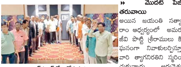
గుజరాత్ టూర్లో అవోప సభ్యులు... అమరజీవి పాట్లీ శ్రీరాములు గాలికి ఘన నివాళి