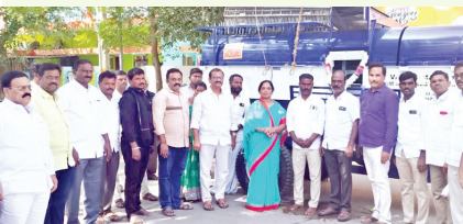
ఆనంతపురం రూరల్ మేజర్ న్యూస్: వ్యవసాయంలో సాంకేతికత చాలా అవసరం అని.. సాగులో