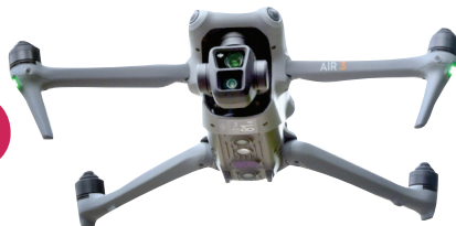
డ్రోన్లు ఆపరేటింగ్ పై శిక్షణను ప్రారంభించిన జిల్లా ఎస్పీ