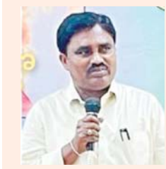
విజయవంతం చేయాలని వారు కోరారు.