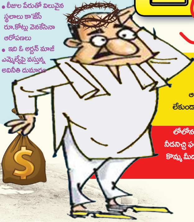
ఆనంతపురం, మేజర్ స్వాస్: