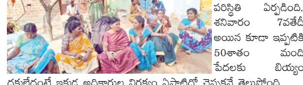
పరిస్థితి ఏర్పడింది. శనివారం 7వతేదీ అయిన కూడా ఇప్పటికీ 50శాతం మంది పేదలకు బియ్యం దక్కలేదంటే ఇక్కడ అధికారుల నిర్లక్ష్యం ఏపాటిదో చెప్పకనే తెలుస్తోంది.

మొదటి పేజీ తరువాయి పేద ప్రజలకు గుర్తుకు వస్తోంది. దీనంతటికీ కారణం ప్రభుత్వం నిర్లక్ష్యం, స్టోర్ డీలర్ల నిర్వాహక ఫలితమే అన్నది. స్పష్టమవుతోంది. పేదల కష్టాలకు వేదికగా ధర్మవరం పట్టణం నిలుస్తోంది. ప్రధానంగా ఈ అష్టకష్టాలు ధర్మవరంపట్టణశివారు ప్రాంతమైన ఇందిరమ్మకాలనీలో చోటు చేసుకుంది రాష్ట్ర ప్రభుత్వం పేదల కోసం అందించే చౌకదాన్యపు బియ్యం, ఇతర సరుకులు ప్రతినెల 1వ తేదీ నుంచి 15వతేదీలోగా అందించాల్సి ఉంటుంది. అయితే ఎన్నీవి ప్రభుత్వం వచ్చిన తరువాత ఆ నిబంధనలకు కొందరు చౌకదాన్యపు డీలర్లు తుంగలోకి తొక్కి ఇష్టారాజ్యంగా వ్యవహరిస్తుండటంతో అసలైన సమస్య దాపురించింది. ప్రస్తుతం ఎప్పుడు స్టోర్లో సరుకులు ఇస్తాలో ఎప్పుడు ఇవ్వరో, ఎప్పుడునోస్టాక్ పెడతాలో తెలియని పరిస్థితి ధర్మవరంలో పలు చోట్ల చోటు చేసుకుంటోంది. ప్రధానంగా శివారు ప్రాంతాలైన ఇందిరమ్మకాలనీ, ఎల్-1, ఎల్-2, ఎల్-3, ఎల్-4 ప్రాంతాలలోఈ సమస్య తీవ్రస్థాయిలో ఉండటం పలువురిని ఆశ్చర్యానికి గురిచేస్తోంది. ఇక్కడ రేషన్ కోసం కూలి పనులు వదులుకుని తెల్లవారుజామున నుంచే సంబం దింత రేషన్ దుకాణం వద్ద తమ వెంట తీసుకెళ్లినసంచులను సీరియల్స్ పెట్టుకుని దుకాణం తెరిచే వరకు ఉండి తెచ్చుకోవాల్సిన పరిస్థితిఏర్పడుతోంది. కొం దర్రతే తెల్లవారుజామున క్యూలో ఉన్న రేషన్ దక్కక ఊసురుమంటూ వెనుతిరిగే