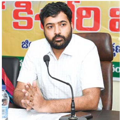
తిరుపతి బ్యూరో, మేజర్ న్యూస్: