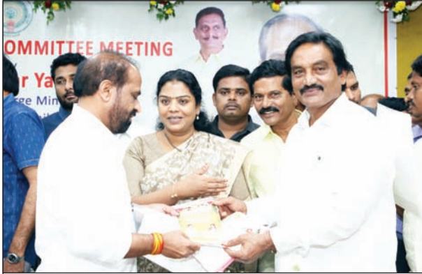
ఆరోగ్య శాఖ మంత్రి సత్య కుమార్ యాదవ్, ప్రభుత్వ విప్ ఎమ్మెల్యే తంగిరాల సామ్యతో నాగేశ్వరరావు