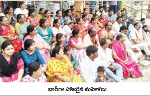
భారీగా హాజరైన మహిళలు