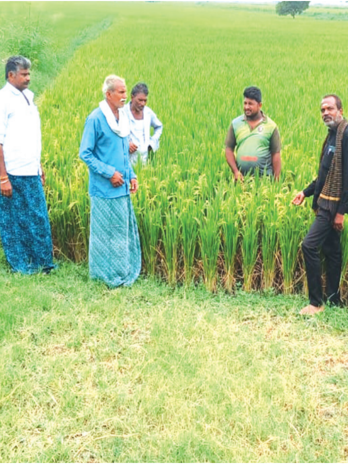
ముప్పాళ్ల, మేజర్ న్యూస్ :