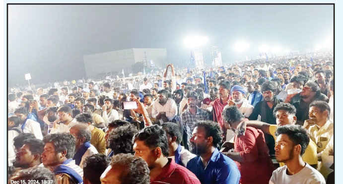
Dec 15, 2024, 18:37