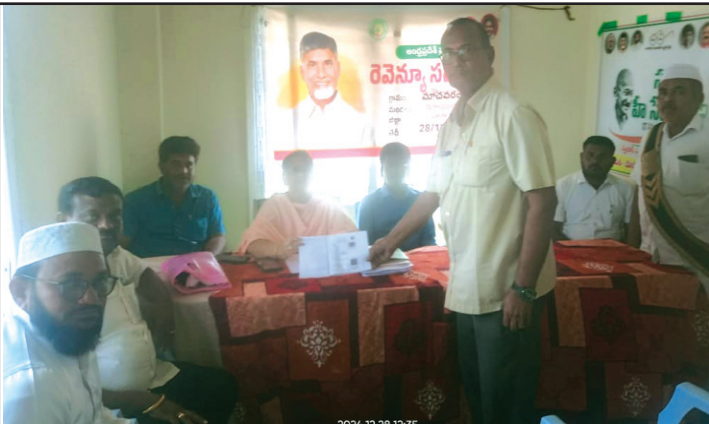
మాచవరం, మేజర్ సూర్య