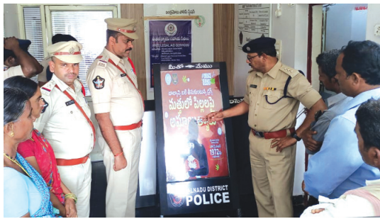
బొల్లపల్లి మేజర్ స్వాస్