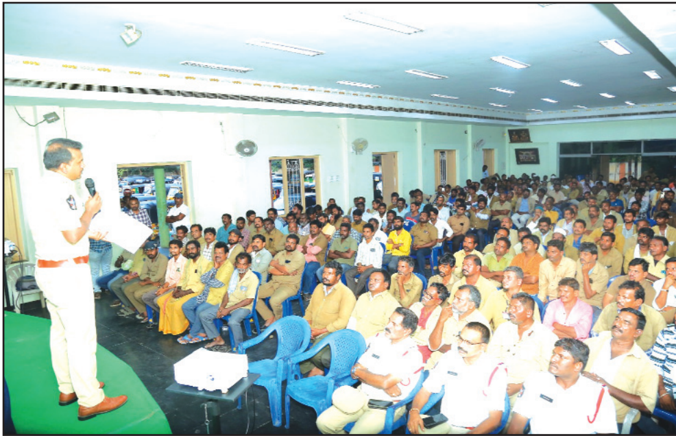
నడిపినప్పుడే ఎటువంటి ట్రాఫిక్ సమస్యలు తలెత్తకుండా ఉంటాయని సూచించారు.

ప్రతి ఆటో కి క్యూ ఆర్ కోడ్ కేటాయిస్తాం..