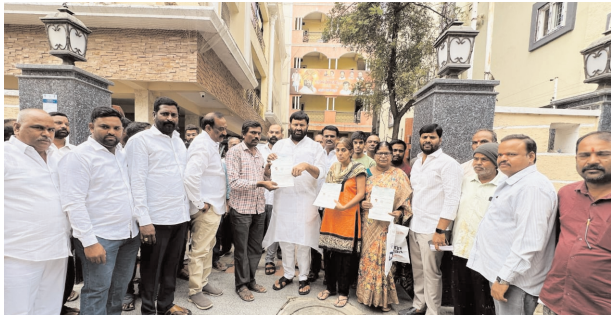
జీడిమెట్ల మేజర్ న్యూస్ : ముఖ్యమంత్రి సహాయనిధితో పేదల వైద్యానికి భరోసా నిలుస్తోంది, నియోజకవర్గంలోని నిరుపేదలందరికీ ముఖ్యమంత్రి