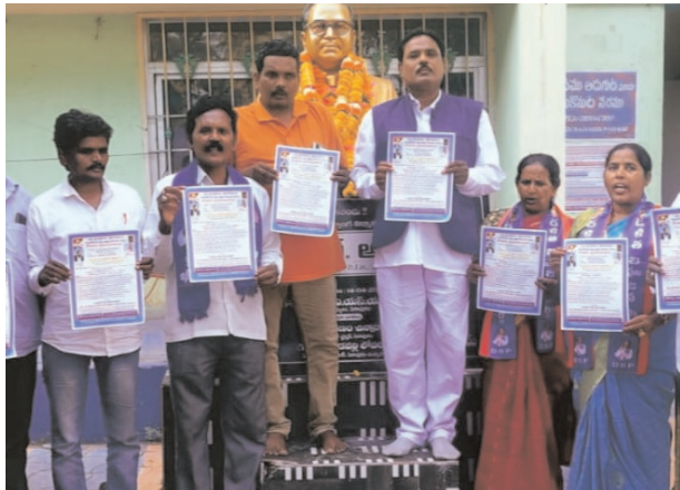
హైదరాబాద్/మేజర్ న్యూస్ : రాజ్యాంగం ద్వారా అధికారం లోకి వచ్చిన చంద్రబాబు, పవన్కృష్ణలు ఎస్సీ వర్గీకరణ జోకీ రాకుండుంటే, మరో సారి