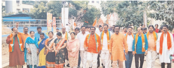
సీతాఫలమండి, మేజర్ న్యూస్: కాంగ్రెస్ ప్రభుత్వ 6 గ్యారెంటీలు విఫలం, 66 మోసాలపై జరుగుతున్న భారీ బహిరంగ సభకు ముఖ్యఅతిథిగా విచ్చేసిన కేంద్రమంత్రి జేపీ నడ్డా కార్యక్రమంలో సికింద్రాబాద్ నియోజకవర్గం నుండి కార్యకర్తలు నాయకులు ఈ కార్యక్రమంలో పాల్గొన్నారు.