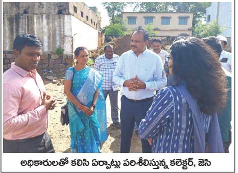
అధికారులతో కలిసి ఏర్పాటు పరిశీలిస్తున్న కలెక్టర్, జెసి