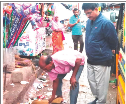
దుకాణందారునితోనే చెత్తను ఎత్తి వేయిస్తున్న కమిషనర్

దుకాణం ముందు చెత్తను చిరువ్యాపారితో ఎత్తించడం తగునా?