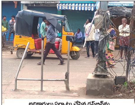
అధికారులు ఏర్పాటు చేసిన డస్ బిన్ ను అవలంబించిన దుండగులు

బద్వేల్, మేజర్ న్యూస్: బద్వేల్ మున్సిపాలిటీ పరిధిలో మార్కెట్లో భాగంగా గత రెండు రోజుల కిందట ప్రధాన రహదారి వెంబడి తినుబండారాలు చేసుకునే చిరు వ్యాపారి దుకాణం వద్ద చెత్త పడి ఉండడం గమనించిన కమిషనర్ ఆ చిరు వ్యాపారి వేశాడనే నెపంతో పలువురి అధికారుల ముందు అతనిచే చెత్త ఎత్తించడం పట్ల పలువురు చిరు వ్యాపారి అంటే కమిషనర్ కి ఇంత చిన్న చూపా అని పలువురు ప్రజలు విమర్శిస్తున్నారు.. పదిమందిలో ప్రత్యేకించి చెత్త